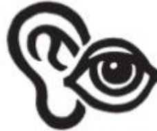
Visual & Hearing Impairments