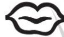
Speech & Language Impairments