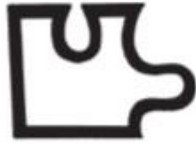
Autism Spectrum Disorder

These symbols are used as signposts to help identify various kinds of disabilities